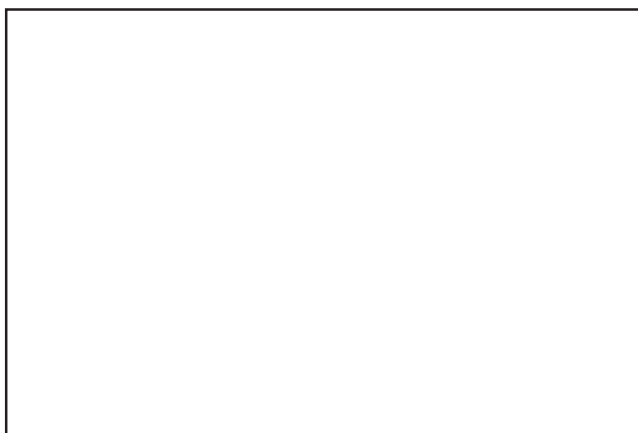
è FOTO: mou kerjasama penelitian, ketersediaan fasilitas penelitian (gambar pengamatan astronomi pfis), siapa punya??